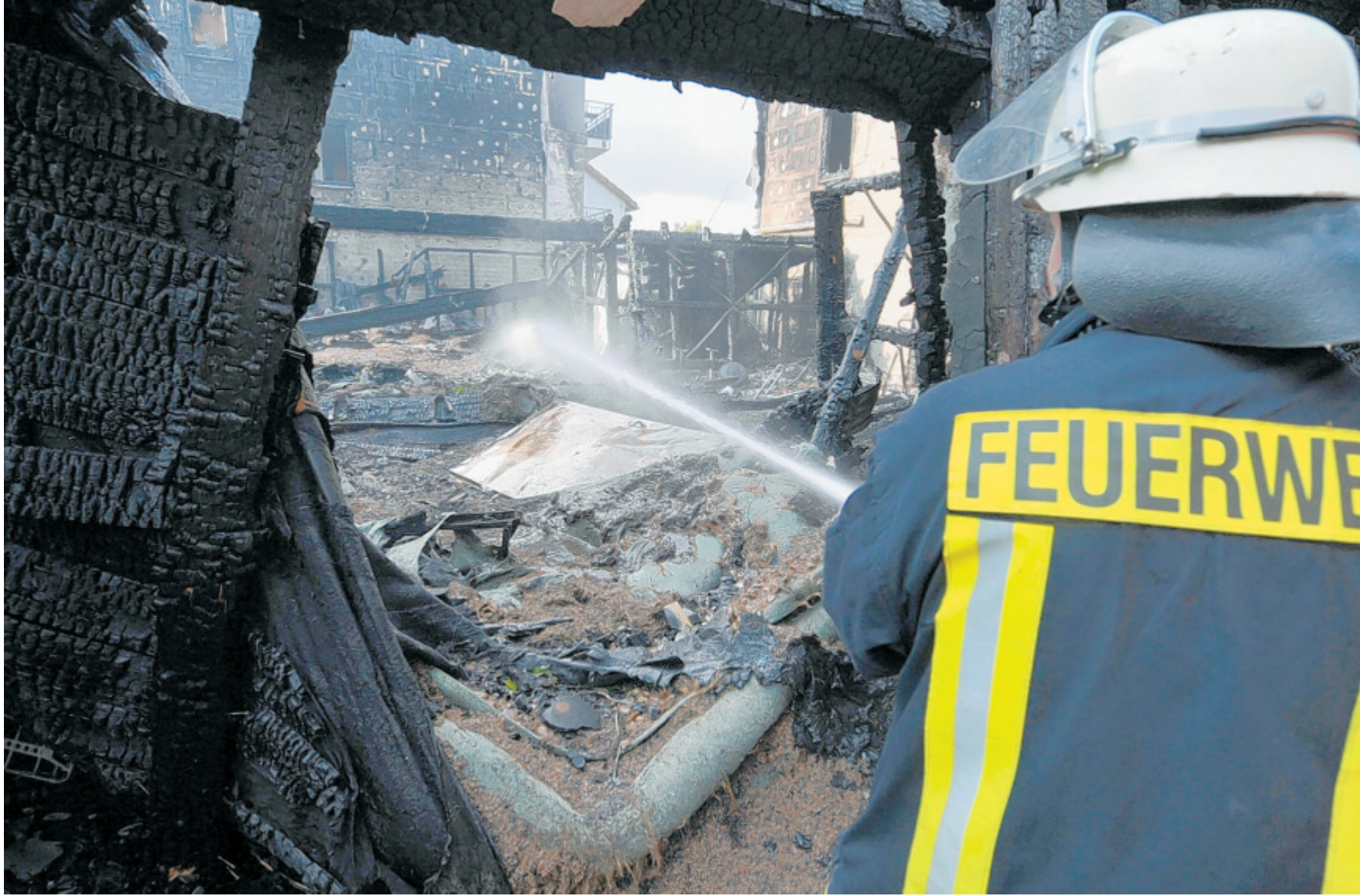
Bundesweit nur Einzelfälle: Wohnungsbrände, bei denen die Wärmedämmung zum Feuer führte, sind reine Ausnahmen.