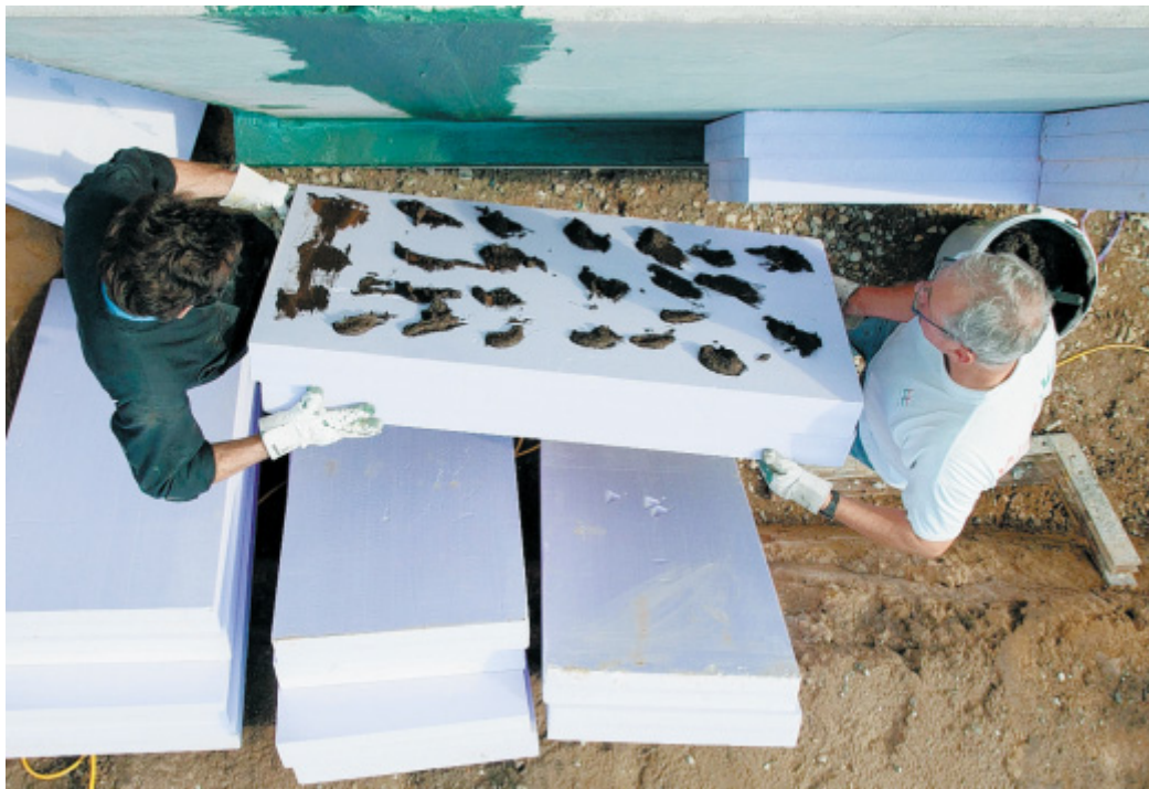
Fachgerechte Installation: Geprüfte Materialien und der Einbau durch Handwerker sichern Bauherren vor Brandgefahr.