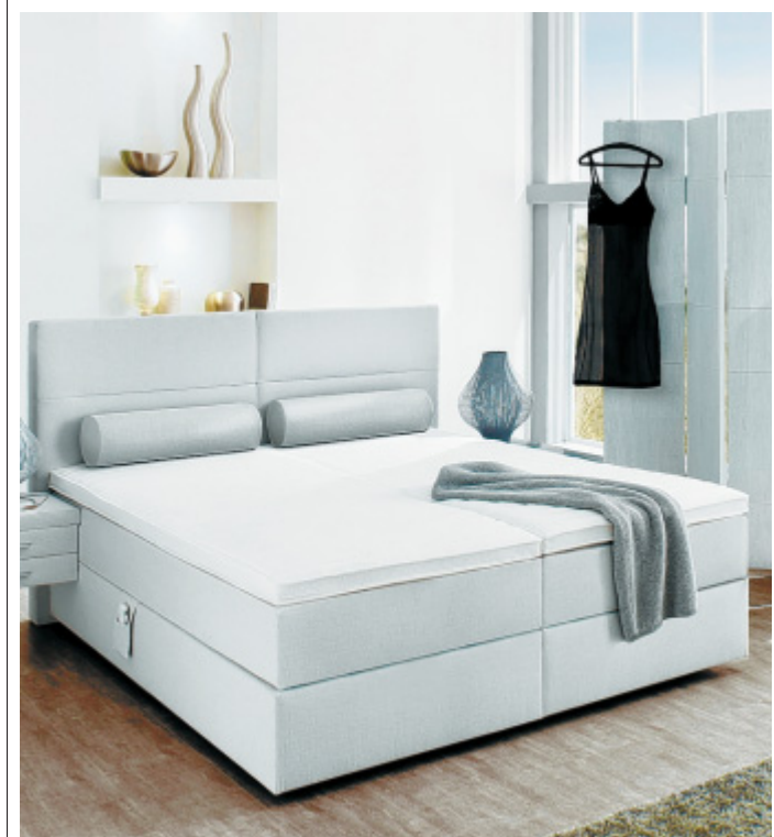
Höher und bequemer: Boxspringbetten kommen aus den USA, haben hierzulande aber auch viele Liebhaber.

Ein Kritikpunkt ist die erschwerte Austauschbarkeit der Matratzen, erläutert der Fachverband auf seiner Homepage. Eine normale Matratze habe aus hygienischen Gründen nach sieben bis zehn Jahren ausgedient. Es müsste beim ausgetauschten Modell möglich sein, die obere Lage auszutauschen, ohne dass dadurch gleich das ganze Bettsystem gewechselt werden muss oder sich die Optik verändert. dpa